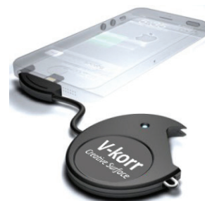
Également disponible : adaptateur micro USB pour les téléphones non compatibles.